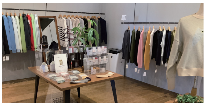
LOOP & LOOP